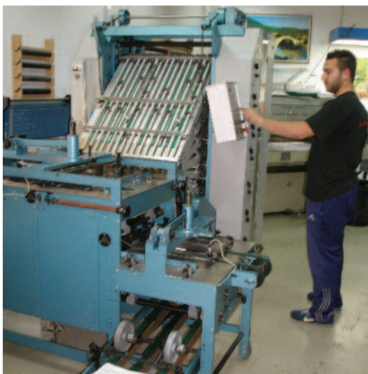
Die generalüberholte Neckar N14 bei Proini: Vollautomatisch Zusammentragen aus dem 14-Stationen-Turm.

Die alte Druckerei im dunklen Erdgeschoss wurde kürzlich ausgelagert und vom Sohn der Familie als eigene Firma in erheblich vergrößerten Räumlichkeiten mit modernem Maschinenpark aus gegründet.